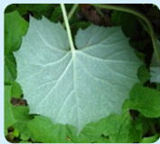
Dessous de la feuille