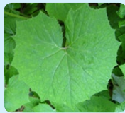
Dessus de la feuille

Feuilles: Feuilles basales: En forme de reins, à long pétiole et bord denté, elles peuvent dépasser 50 cm de diamètre. Elles sont de couleur vert blanchâtre et densément poilues sur les deux faces. Les feuilles basales apparaissent après la floraison. Feuilles de la tige: Alternes, allongées et pointues, sessiles. Fleurs: Fleurs regroupées en capitules eux mêmes regroupés en grappes. Les capitules ont de couleur blanche, d'environ 1cm de diamètre. Fruits: Akène avec aigrette blanche. Protection: Cette plante n'est pas protégée en Suisse. Confusions: Autres pétasites et Pas-d'âne après la floraison: ses feuilles blanchâtres, en forme de rein et dentées permettent toutefois de la distinguer. A savoir: Autrefois, le beurre était conservé enroulé dans ces grandes feuilles.