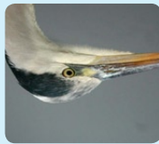
Tête de héron cendré

Aucune confusion possible dans nos régions.