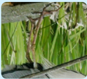
Échasses de héron cendré