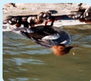
Femelle et sa portée

La plupart du temps il est muet. A savoir: Le harle bièvre est un excellent plongeur, gros consommateur de poissons. Il plonge entre 20 et 30 secondes et peut s'enfoncer jusqu'à 10 mètres de profondeur. Confusions: Son long bec fin et crochu, de couleur rouge, permet de le différencier d'autres espèces de canards.