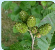
Fruits de l'aune blanchâtre