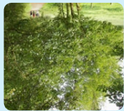
Vue d'ensemble d'un aune blanchâtre

Aune glutineux: l'écorce de l'aune blanchâtre reste lisse même après vieillissement, alors qu'elle se crevasse chez l'aune glutineux. Le nombre de paires de nervures des feuilles change également.